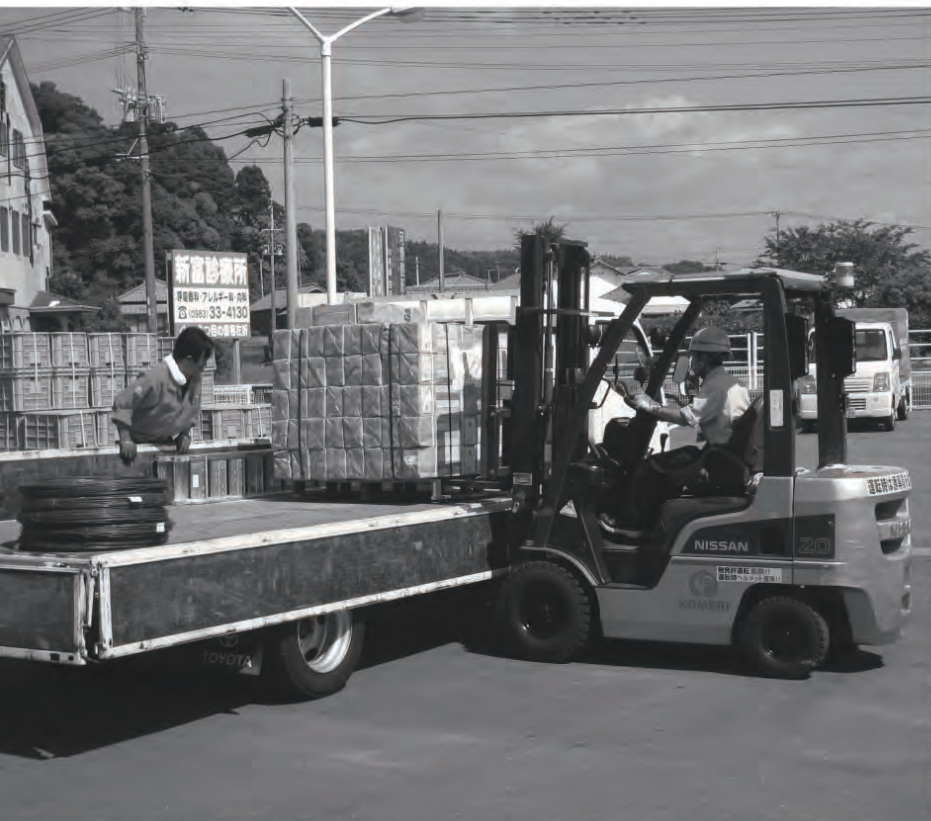
2010年に宮崎県で発生した口蹄疫。家畜伝染病ではこれが初めての対応。現地周辺の店舗と連携し、模索しながら物資の引き渡しを行った。