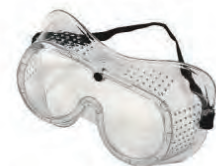
セーフティゴーグル