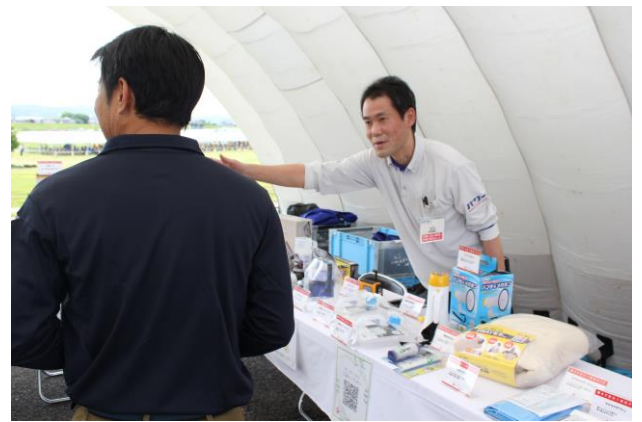
訓練：防災用品の展示

災害協定 http://www.komeri-npo.org/network/agreement.html