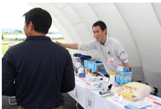
訓練：防災用品の展示