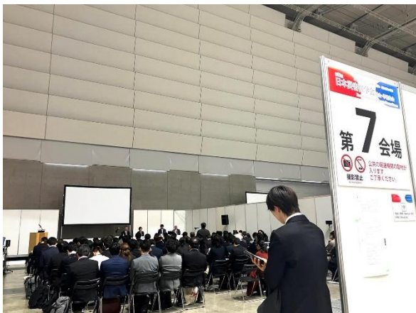
・写真3 講演会場の様子※