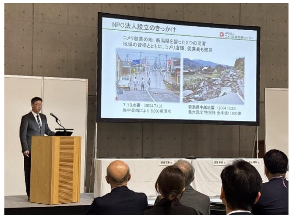
・写真4 NPO法人コメリ災害対策センター 活動内容についてご説明